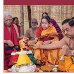
4. Religious Devotion, age 72 & onward Sannyasa Ashrama